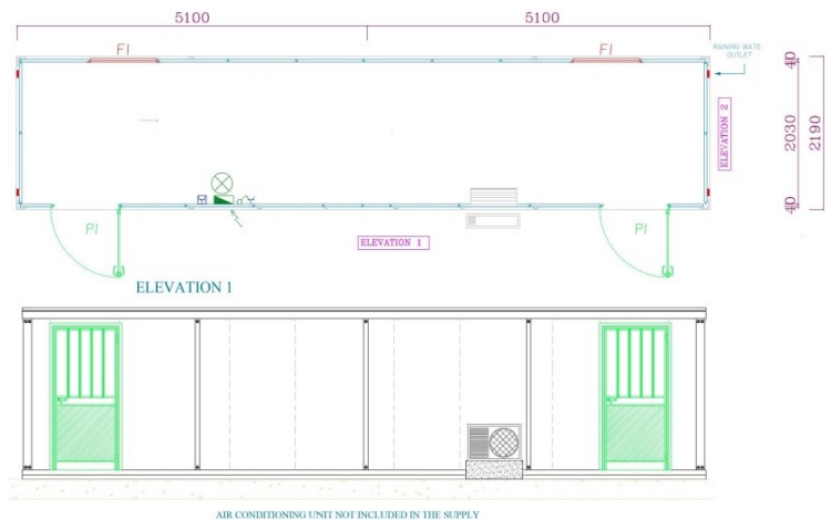
Ejemplo: Unión de dos Módulos 5100x2200mm Aplicación estándar en 1 nivel