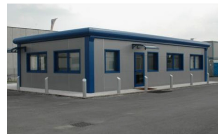
Aplicación especial a pedido en 1 nivel