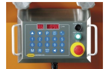
Panel Electrónico 10/50

Este accesorio debe pedirse junto con la máquina y no puede instalarse después de la compra.