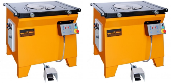
Dobladoras de varilla NIC Profesional - Modelo N

Descripción general: Dobra desde 10° hasta 180° para cualquier diámetro de varilla. El plato de doblado gira en dos sentidos. La rotación se controla por medio de un inversor ubicado en el tablero, botón de retorno y orificios de ajuste para el doblaje. Incluye tambores o rodillos guías para radios de doblaje desde 35 mm, escuadra de doblaje para varillas de diámetros pequeños (8mm), herramienta y engrasador. Motor: Eléctrico 220V/60Hz (380V/50Hz) Trifásico. Equipado con sistema de protección térmica que adapta la potencia del motor para garantizar la protección en caso de sobrecarga. Para evitar el calentamiento, el motor tiene un sistema de frenado del disco doblador. Tablero eléctrico: El equipo cuenta con interruptor de encendido/apagado, interruptor térmico, botón de paro de emergencia y botón para la regulación de velocidad. Pedal: El equipo cuenta con un pedal remoto para su funcionamiento con protección para el cable. Cuerpo: El reductor