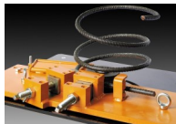
Accesorio para hacer Espirales S18

Este accesorio se puede comprar después de la máquina y se puede instalar o quitar fácilmente en cualquier momento.